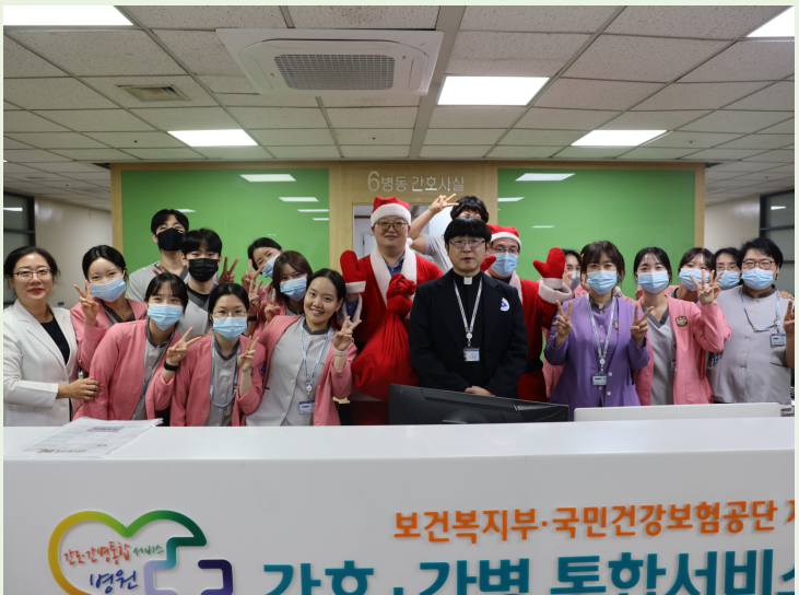
▲ 성탄절 기념 환우 선물나눔 행사 현장 사진