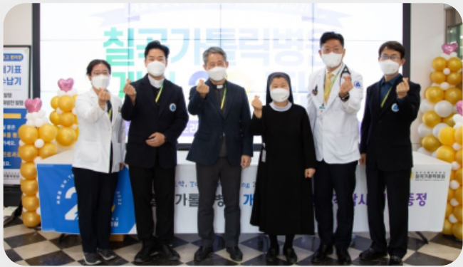
#칠곡가톨릭병원 개원 20주년! 화이팅!