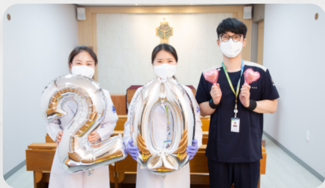
#개원 20주년 기념 영상 촬영 중이에요!ㅎㅎ