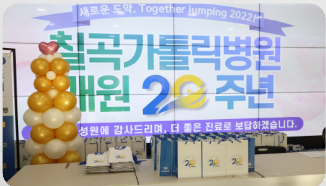
#감사한 마음을 전달하는 선물도 있어요!

대구가톨릭대학교 칠곡가톨릭병원은 지난 3월 2일 별관 3층 강당에서 개원 20주년을 맞아 기념식을 개최 하였습니다. 이날 기념 행사에서는 신규 진료과장 소개, 기념 영상 상영, 내·외빈 축하 메시지 낭독, 20년 장기근속 직원 시상, 새병원 공사계획발표, 병원장 축사 순으로 진행 되었습니다. 이번 행사를 통해 지난 20년간 쌓아온 성과를 되돌아보고, 다가올 새로운 미래와 비전을 함께 공유하며 이를 이뤄나가기 위해 투철한 사명감을 가지고 모두가 하나 되어 함께 걸어갈 것을 약속 하였습니다.