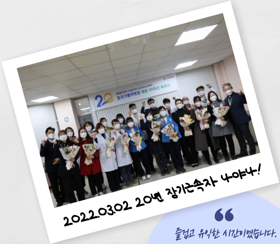
2022.03.02 20년 장기근속자 4야나!

대구가톨릭대학교 칠곡가톨릭병원은 지난 3월 2일 별관 3층 강당에서 개원 20주년을 맞아 기념식을 개최 하였습니다. 이날 기념 행사에서는 신규 진료과장 소개, 기념 영상 상영, 내·외빈 축하 메시지 낭독, 20년 장기근속 직원 시상, 새병원 공사계획발표, 병원장 축사 순으로 진행 되었습니다. 이번 행사를 통해 지난 20년간 쌓아온 성과를 되돌아보고, 다가올 새로운 미래와 비전을 함께 공유하며 이를 이뤄나가기 위해 투철한 사명감을 가지고 모두가 하나 되어 함께 걸어갈 것을 약속 하였습니다.